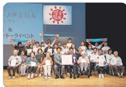
第8期表彰式の様子